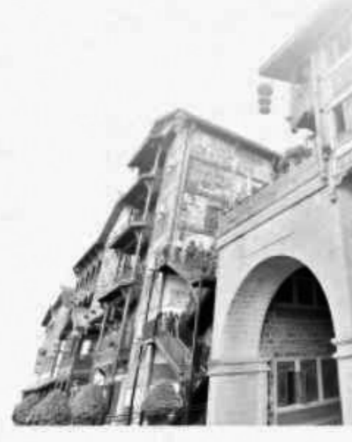
左上图为三星堆面具 中上图为大足石刻 下图为洪崖洞

如今，十四艺节已经落幕，但艺术与山水的邂逅、双城与民心的相融仍在延续。这场国家级盛会不仅为巴蜀文化旅游走廊建设注入了新动力，成为巴蜀文化旅游走廊建设的标志性成果，更为川渝两地开启了一个文旅共建共享的新时代。