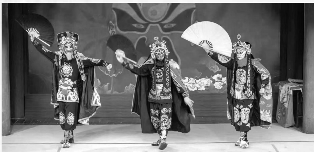
植根于巴蜀文化土壤的川剧表演

艺术的盛会，人民的节日。这个秋天，十四艺节开启“巴蜀时间”。剧场内精彩迭起，剧场外以演出串联，川渝两地推出品质打卡地，举办文旅惠民活动，拓展文旅消费新空间。润物无声，艺韵绵长，人们在“诗和远方”中找到感动和幸福。