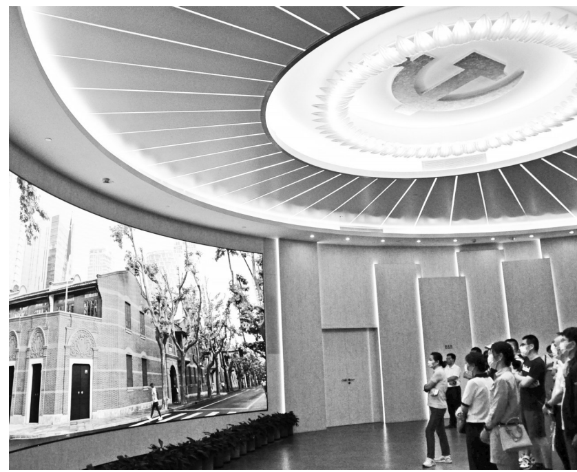
观众在中共一大纪念馆参观

组成，第1、2、3圆环为核心表演区及布景区，第4、5圆环既是舞台也是观众席。演员与观众近距离接触，表演空间与观演空间相互交融，为观众打造真实感很强的场景。此外，空间的变换使观众产生沉浸式的视觉体验。在表演过程中，5个圆环独立旋转，不断切换场景，观众位置不同，看到的內容也有差异。舞台巧妙的设计使表演空间呈现出开放及半开放模式，营造出了良好的视觉体验和空间感受，增强了红色文化内容的传播立体化和空间感，使观演者近距离感受空间感的真实特性，进而了解红色历史。