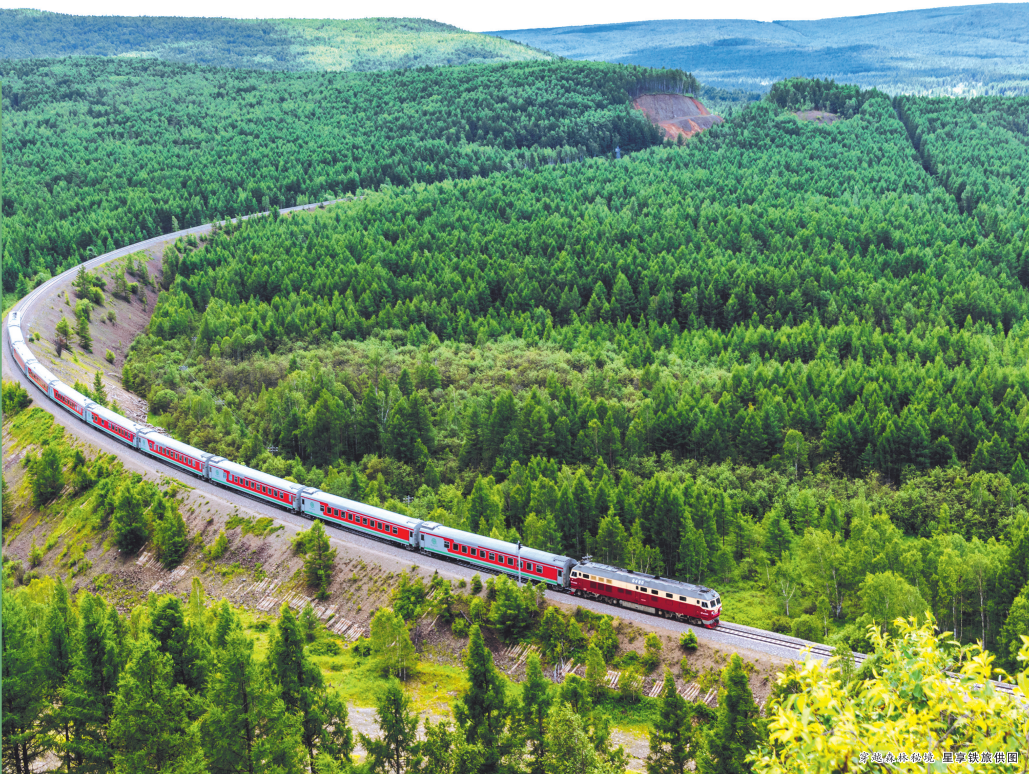
穿越森林秘境,尽享

让我们“相约草原·携手春天”,开启“亮丽北疆”绿色、向美、幸福之旅。在文明旅游的旅途中,如您遇到任何问题与不便,可随时拨打便民热线12345。