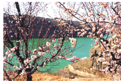
黄河大峡谷盛开的杏花

验多样的自然风光、浓郁的民族风情。主要的旅游节点:金沙湾、大青沟、孝庄园、哈民遗址、珠日河草原旅游区、扎鲁特山地草原、可汗山自驾游露营地等。