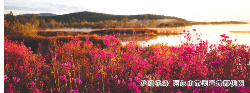
杜鹃花海