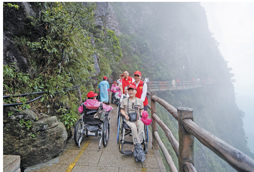
莽山五指峰景区为残障游客提供服务

的知名度也在不断攀升。“山上的风景很美，但更令人惊叹的是人们建造了所有这些设施，电梯和自动扶梯令人印象深刻。”近日，韩国某游客体验完莽山景区的美景和无障碍设施后，在海外的视频社交平台上感叹道。