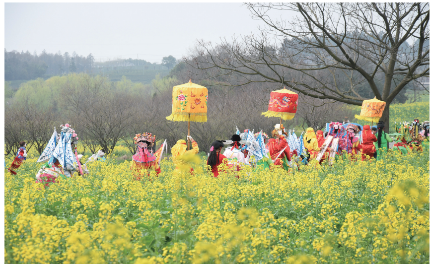
南京高淳金花旅游节开幕式现场

清晨油菜染黄，蜂蝶寻香映彩霞。近日，由江苏省文化和旅游厅、中国旅游报社、南京市文化和旅游局指导，高淳区人民政府主办，江苏省高淳国际慢城旅游度假区管委会承办的第十五届中国·高淳国际慢城金花旅游节如约而至。一望无际的金色花海中，东坝大马灯、跳五猖、舞狮等非遗民俗演出穿插其中，游客漫步闲谈、合影留念，感受春日浪漫。