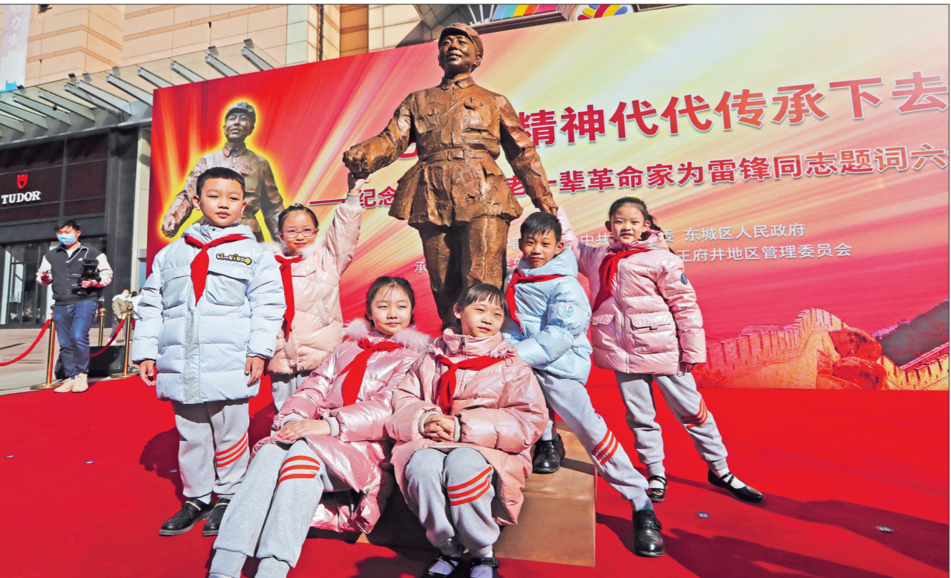
精神代代传承下去 老一辈革命家为雷锋同志题词六十年纪念

3月1日,由中国美术馆、北京市东城区委、区政府主办的“把雷锋精神代代传承下去——纪念毛泽东等老一辈革命家为雷锋同志题词六十周年”活动在王府井步行街举办,雷锋铜像在现场揭幕,吸引大批市民游客前来瞻仰雷锋铜像、传承雷锋精神。图为小学生们与雷锋铜像合影留念。 本报记者 张玫/文