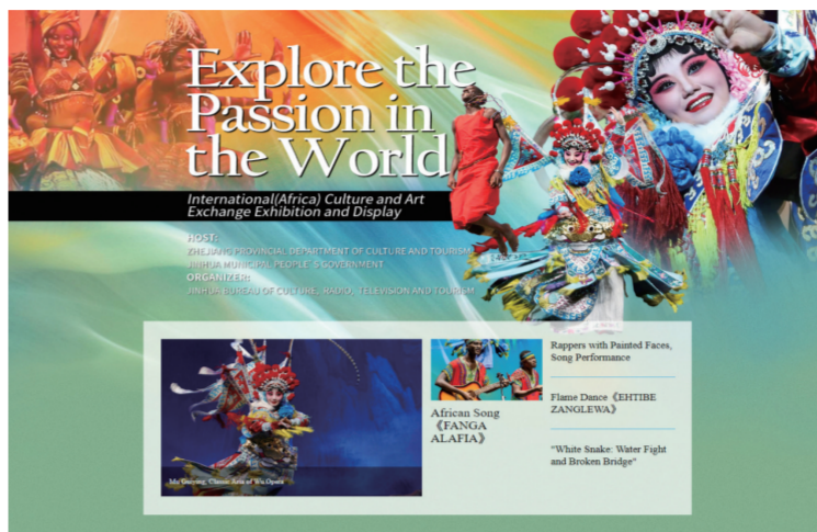
“激荡世间热爱”2022国际(非洲)文化艺术交流展播