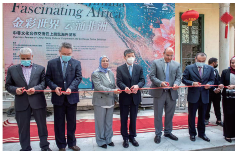
“金彩世界 云涌非洲”中非文化合作交流周云上展览埃及发布

此次活动以“民心相通、文化互鉴、合作共赢”为主基调,6场别具特色的文旅活动通过“线上线下全路径、大屏小屏全覆盖、境内境外全领域、文化经贸全方位”的创新模式进行,充分展现诗画浙江的风采,描绘水墨金华的特色。