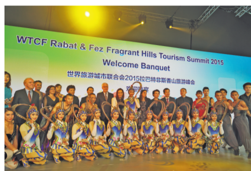
2015拉巴特非斯香山旅游峰会欢迎晚宴

这非凡的十年，是联合会坚守初心的使命绽放，是助力世界旅游业繁荣的希望远航。未来可期，联合会将发挥桥梁纽带作用，推进和实施世界文化和全球旅游的多边合作和交流，携手世界旅游城市，共同推动世界旅游业的发展，创建更美好的旅游城市生活。