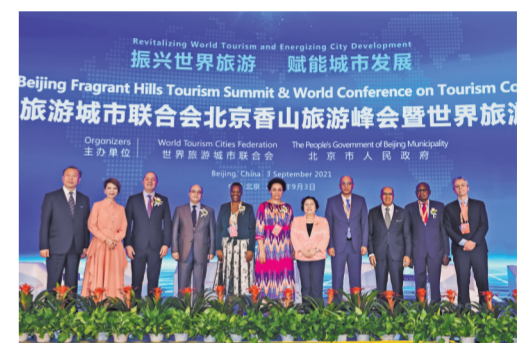
2021世界旅游城市联合会北京香山旅游峰会暨2021世界旅游合作与发展大会