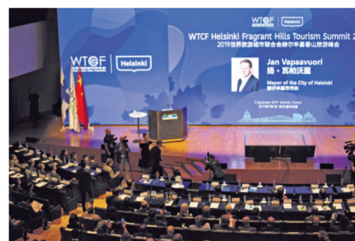
2019世界旅游城市联合会赫尔辛基香山旅游峰会