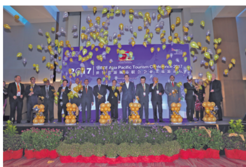
2017世界旅游城市联合会亚太旅游论坛