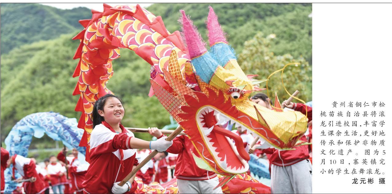
贵州省铜仁市松桃苗族自治县将滚龙引进校园,丰富学生课余生活,更好地传承和保护非物质文化遗产。图为5月10日,寨英镇完小的学生在舞滚龙。

额济纳胡杨林景区常务副总经理王铮表示:“门票优惠一方面是为了提高内蒙古旅游业口碑,另一方面也是为了在常态化疫情防控下进行自救,推动‘内蒙古人游内蒙古’。”