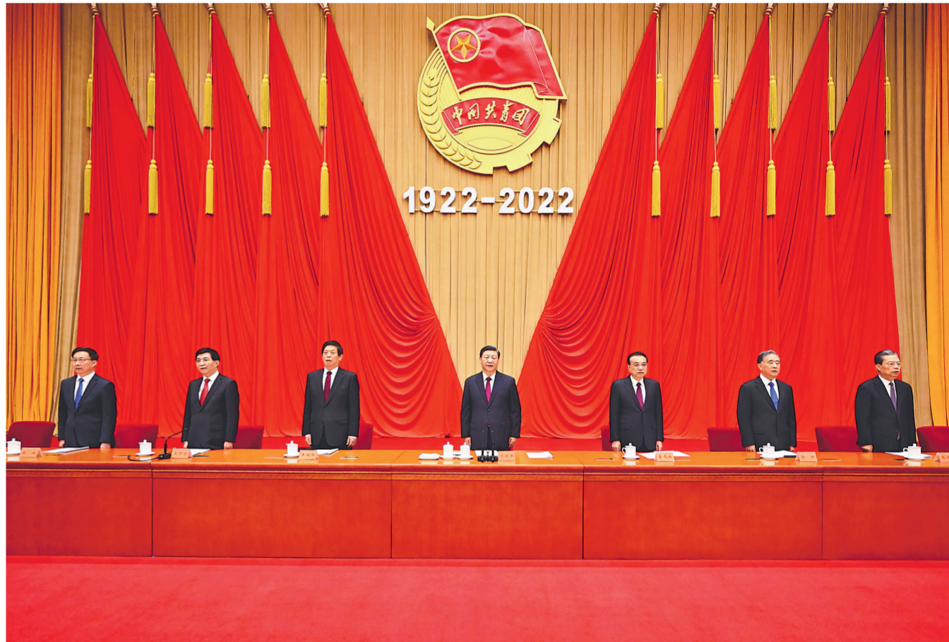
5月10日,庆祝中国共产主义青年团成立100周年大会在北京人民大会堂隆重举行。习近平、李克强、栗战书、汪洋、王沪宁、赵乐际、韩正等出席大会。新华社记者 李学仁 摄

新华社北京5月10日电 庆祝中国共产主义青年团成立100周年大会10日上午在北京人民大会堂隆重举行。中共中央总书记、国家主席、中央军委主席习近平在会上发表重要讲话强调,青春孕育无限希望,青年创造美好明天。新时代的中国青年,生逢其时、重任在肩,施展才干的舞台无比广阔,实现梦想的前景无比光明。实现中国梦是一场历史接力赛,当代青年要在实现民族复兴的赛道上奋勇争先。共青团要牢牢掌握培养社会主义建设者和接班人的根本任务,坚持为党育人、自觉担当尽责、心系广大青年、勇于自我革命,团结带领广大团员青年成长为有理想、敢担当、能吃苦、肯奋斗的新时代好青年,用青春的能动力和创造力激荡起民族复兴的澎湃春潮,用青春的智慧和汗水打拼出一个更加美好的中国。 中共中央政治局常委李克强、栗战书、汪洋、王沪宁、赵乐际、韩正出席大会。 人民大会堂二层宴会厅气氛隆重热烈。主席台上方悬挂着“庆祝中国共产主义青年团成立100周年大会”会标,