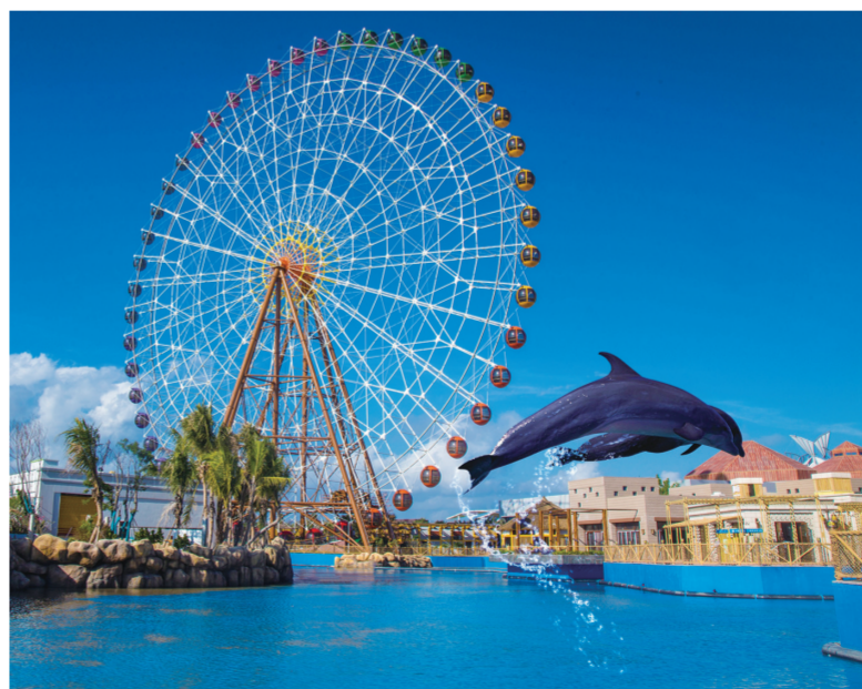
三亚海昌梦幻海洋不夜城