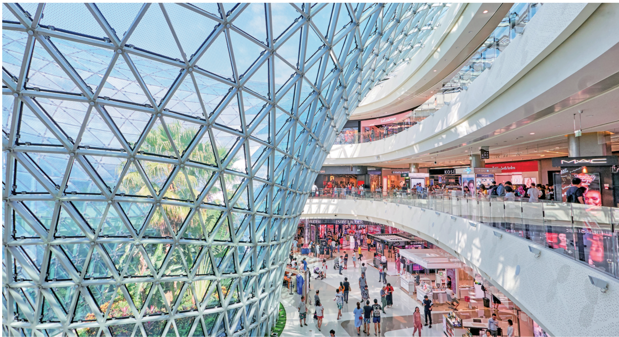
三亚海棠湾免税购物中心(资料图)

数据显示,2021年海南接待国内外游客8100.43万人次,同比增长25.5%,恢复至2019年的97.5%;旅游总收入1384.34亿元,同比增长58.6%,较2019年增长30.9%,实现了“十四五”旅游业高质量发展良好开局。