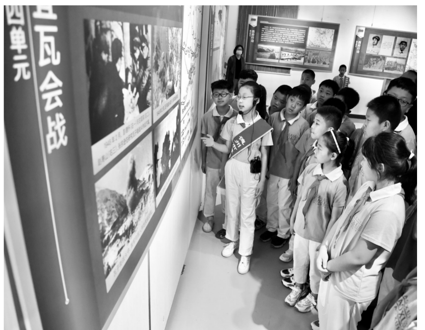
德州市博物馆邀请优秀小学生志愿者担当红色讲解员，小讲解员们将自己的感受融入讲解中，让讲解更具吸引力。