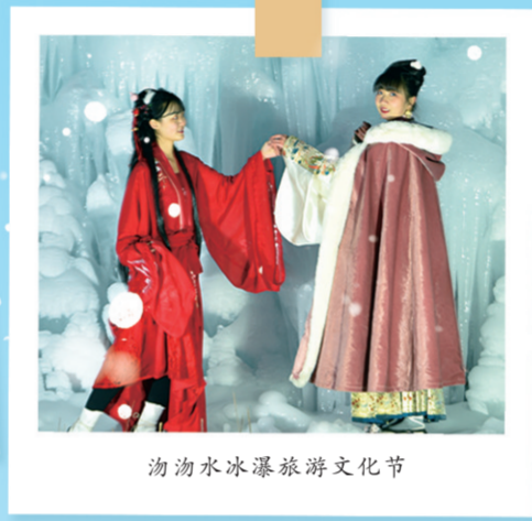
洺河水冰瀑旅游文化节