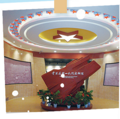
中共中央统战部旧址

石家庄市文化广电和旅游局温馨提示：石家庄市内冬季开放的景区、场馆等，已全面做好疫情防控工作。广大游客进入景区，须严格按照疫情防控要求佩戴口罩、测量体温、出示绿色健康码、保持一米安全距离，安全有序游览观光。