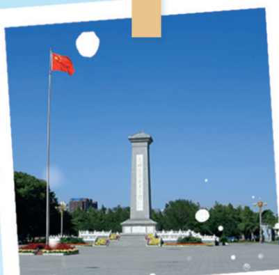
华北烈士陵园纪念碑