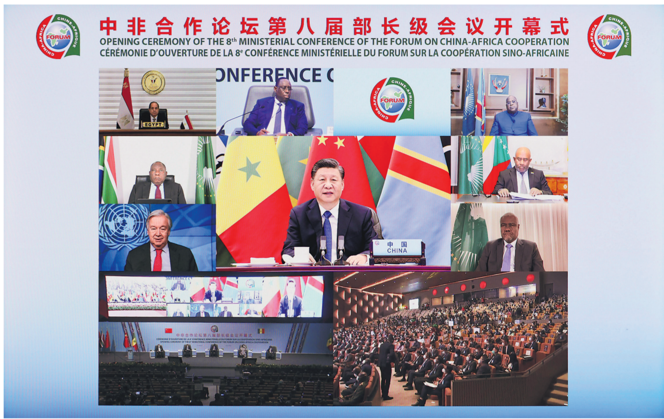
11月29日晚,国家主席习近平在北京以视频方式出席中非合作论坛第八届部长级会议开幕式并发表题为《同舟共济,继往开来,携手构建新时代中非命运共同体》的主旨演讲。