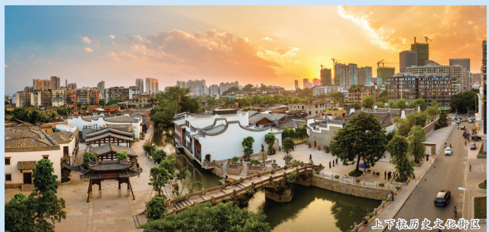
上下杭历史文化街区