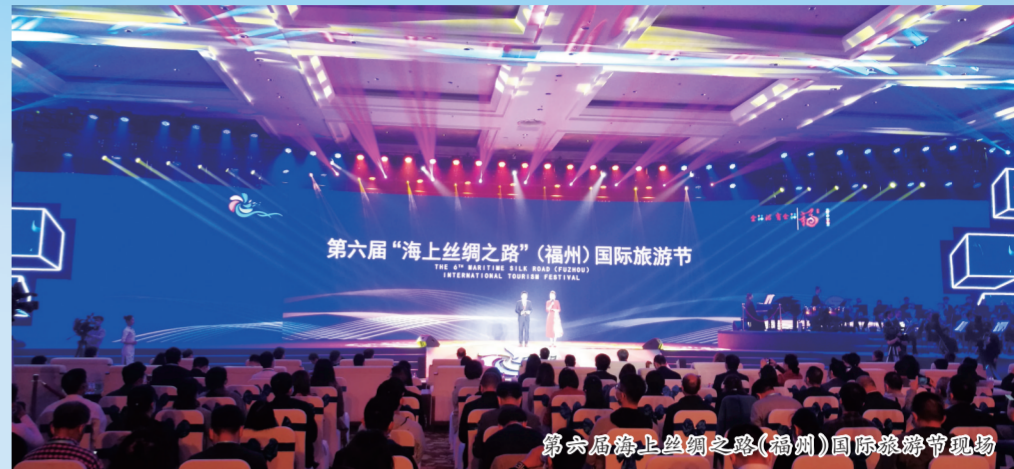
第六届“海上丝绸之路”（福州）国际旅游节现场

据介绍，11月24日至12月15日，本届海丝国际旅游节将配套举办“第十二届福州国际温泉节”，以永泰为主会场，串联周边优质旅游资源，同步在鼓楼、闽清、闽侯和连江等县区20个温泉景区持续联动开展各个主题的温泉节分会场活动，如永泰的“康养+温