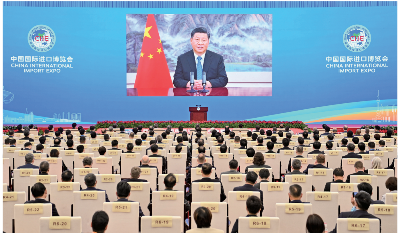
11月4日晚,国家主席习近平以视频方式出席第四届中国国际进口博览会开幕式并发表题为《让开放的春风温暖世界》的主旨演讲。

新华社北京11月4日电 11月4日晚,国家主席习近平以视频方式出席第四届中国国际进口博览会开幕式并发表题为《让开放的春风温暖世界》的主旨演讲。