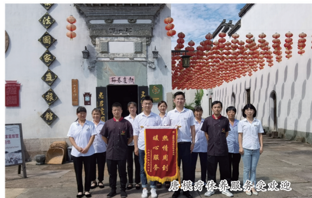
唐模游客服务受欢迎