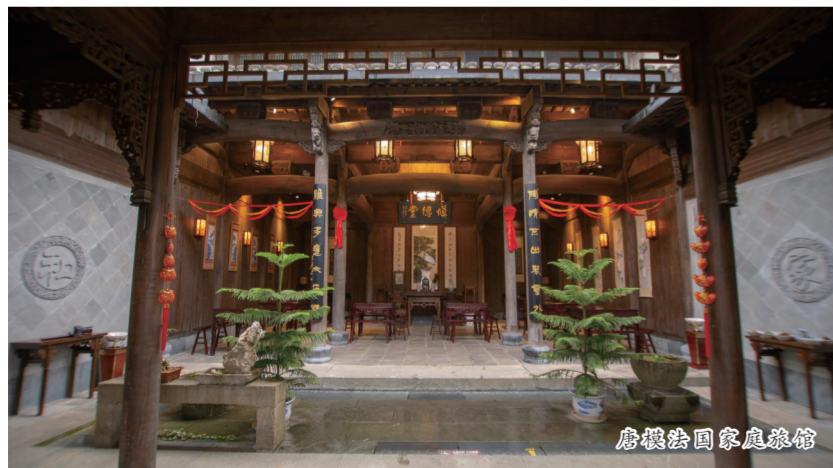
唐模国家家庭旅馆