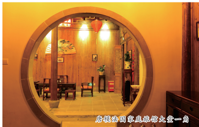
唐模国家家庭旅馆大堂一角