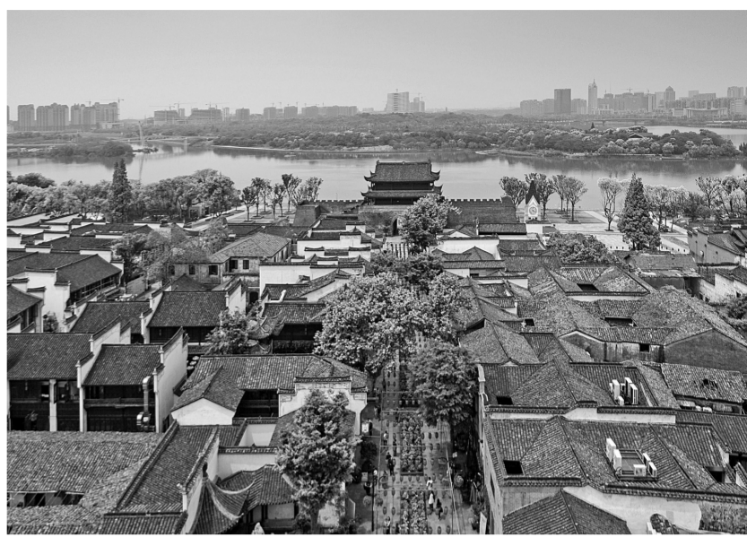
南孔圣地文化旅游区