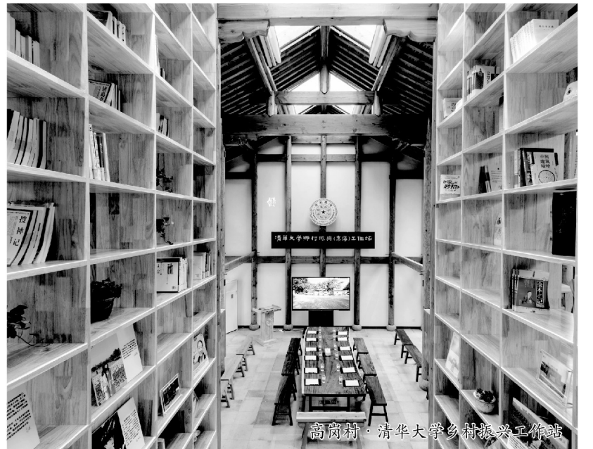
高岗村·清华大学乡村振兴工作站