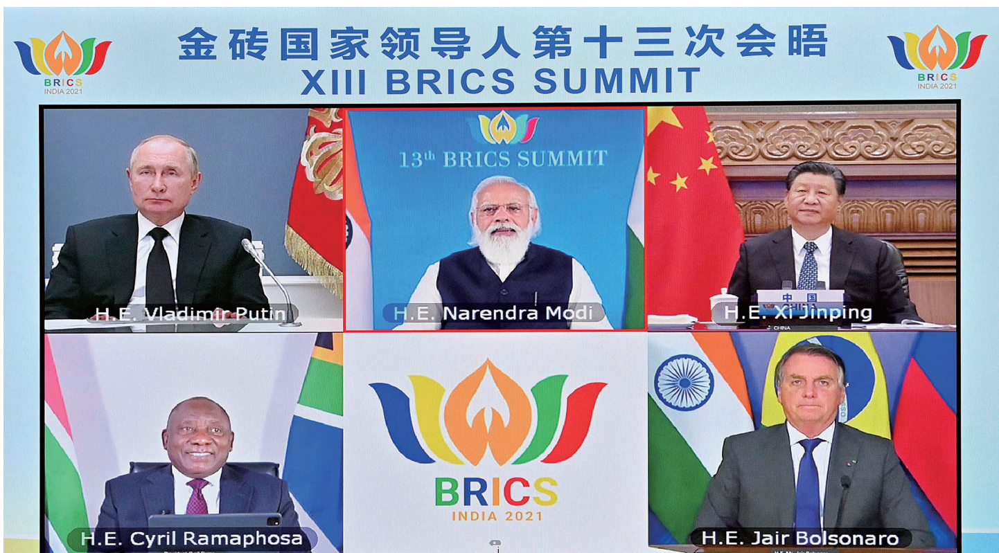
9月9日晚,金砖国家领导人第十三次会晤以视频方式举行。国家主席习近平在北京出席会晤并发表重要讲话。南非总统拉马福萨、巴西总统博索纳罗、俄罗斯总统普京出席,印度总理莫迪主持会晤。

新华社北京9月9日电 金砖国家领导人第十三次会晤9日晚以视频方式举行。中国国家主席习近平、南非总统拉马福萨、巴西总统博索纳罗、俄罗斯总统普京出席,印度总理莫迪主持会晤。