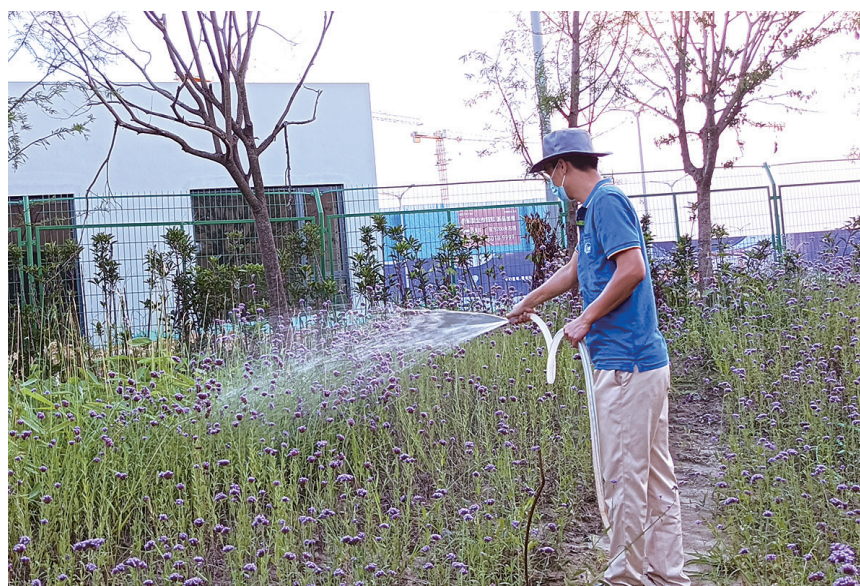
疫情防控期间做好景区维护

扬州华侨城相关负责人表示，疫情波动的这段时间，扬州华侨城一方面严格做好员工动态管理，及时调整办公模式、开展线上培训，并为宿舍员工送去了生活物资，保障员工的身心健康。另一方面苦练内功，积极谋划下半年的梦幻之城运营、节庆活动等工作。“接下来，我们计划针对家庭客群及年轻客群开展艺术、青春类主题活动，吸引本地及周边区域的游客，为进一步推动市场复苏做好准备。”该负责人说。