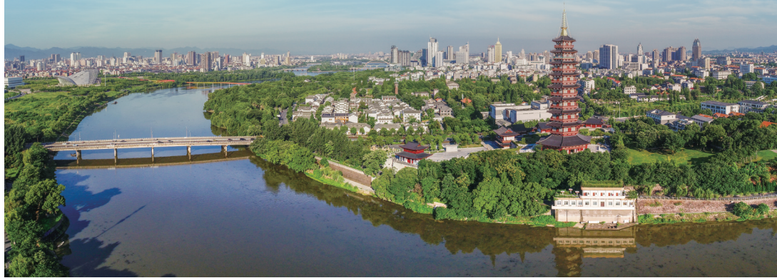
金华三江六岸部分景观

打开浙江省行政地图，中心点就落在金华市磐安县。“十三五”以来，这个曾经的贫困县为发展休闲旅游业累计投入7.5亿元，这是金华文化和旅游工作的一个缩影。近年来，金华市文化广电旅游局对内提品质，对外树品牌，打造了“浙江之心 水墨金华”的文旅形象体系，在文旅IP、文创精品、融合宣传等方面下大力气，让金华文旅品牌在长三角、全国乃至世界范围内打响。