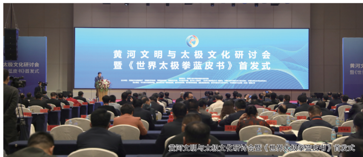
黄河文明与太极文化研讨会暨《世界太极拳蓝皮书》首发式

形势下,接待旅游包车专列大巴团队26列次,游客人数收入进入正增长,受到上级主管部门的充分肯定和高度评价。