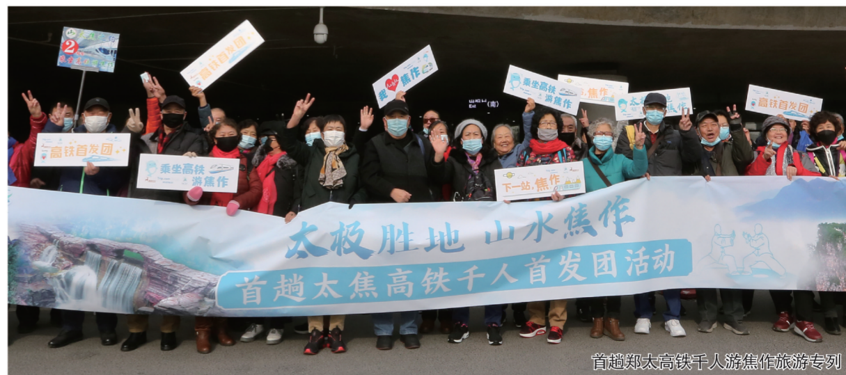
首趟太焦高铁千人游焦作旅游专列

旅游民宿实现“品牌化”。全市新增民宿50家,其中,云台山上小镇民宿街区爆红全国,云上院子等4家民宿被评为全省精品民宿,云上森兮等6家民宿被评为全市精品民宿,数量、质量均在全省领先。乡村旅游实现“品牌化”。孟州市西虢镇莫沟村、修武县云台山镇岸上村入选第二批“全国乡村旅游重点村”,大南坡村、十二会村、寨卜昌村等9个村获评“河南省乡村旅游特色村”,云上的院子获评“河南省休闲观光园区”,温县祥云镇、沁阳市常平乡获评“河南省特色生态旅游示范镇”。