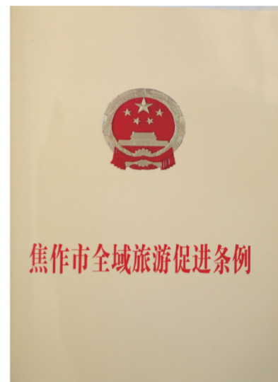
焦作市全域旅游促进条例