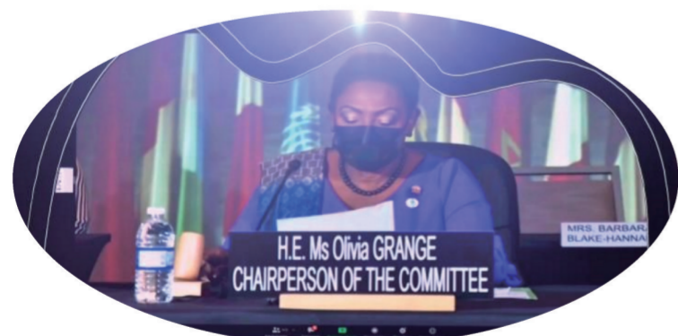
联合国教科文组织保护非物质文化遗产政府间委员会会议主持人奥利维娅·格兰奇女士敲响了木槌标志中国太极拳正式列入《人类非物质文化遗产代表作名录》

宝剑锋从磨砺出,梅花香自苦寒来。2020年12月17日,在牙买加首都金斯敦召开的联合国教科文组织保护非物质文化遗产政府间委员会第15次会议上,太极拳成功通过评审,被列入《人类非物质文化遗产代表作名录》。这也成为河南省第一个牵头申报被列入《人类非物质文化遗产代表作名录》的项目。太极拳的成功申遗,不仅是河南省文化和旅游发展中的一件大事,也是全国传统武术类第一个人类非物质文化遗产,为河南文化和旅游的发展又增添了一个具有世界影响力的文化和旅游品牌,使得太极拳这一融“健身、养生、悟道”于一体、蕴含着“天人合一、刚柔并济、内外兼修”丰富内涵,被誉为“中华武术的精髓”“东方文化的瑰宝”的非物质文化遗产,走向国门,走向世界,成为中国连接世界的一张极具影响力的国家名片。这对于推动河南“中原功夫文化”等文化品牌走向世界,对于打造以“云台山、嵩山”“太极拳、少林拳”为主要内容的“两山两拳”区域生态文化旅游融合示范带,促进河南文化和旅游融合高质量发展,加快推进河南文化和旅游强省建设步伐,都有着十分重要的作用和积极深远的意义。