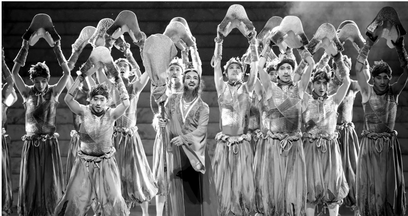
《彩虹之路》舞剧

发展，深入省内各地农村、企业、学校和军营，开展“我们的中国梦——文化进万家”“红色文艺轻骑兵”等近万场演出活动，将演艺渗入到基层每个地方。《丝路花雨》《又见敦煌》《回道张掖》《彩虹之路》等旅游演艺剧目，自创排运营以来已累计演出5036场，接待国内外游客345.85万人次，总收入3.85亿元。